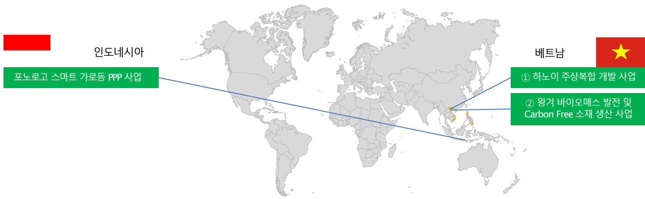
< 2023년 신규 선정 타당성조사(F/S) 지원사업 >

KIND는 국토교통부로부터 위탁 받아 해외인프라도시개발사업 타당성조사(F/S) 지원사업을 시행하고 있으며, 지난 2월 선정된 4건의 타당성조사에 이어 5월에 신규사업 3건을 선정하였다.